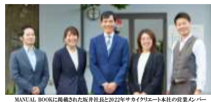
MANUAL BOOKに掲載された坂井社長と2022年サカイクリエート本社の営業メンバー

優良派遣事業者認定制度とは、法令を遵守しているだけでなく、派遣社員のキャリア形成支援やより良い労働環境の確保、派遣先でのトラブル予防など、 派遣社員と派遣先の双方に安心できるサービス を提供できているかどうかについて、一定の基準を満たした派遣事業者が「優良派遣事業者」として認定される制度です。